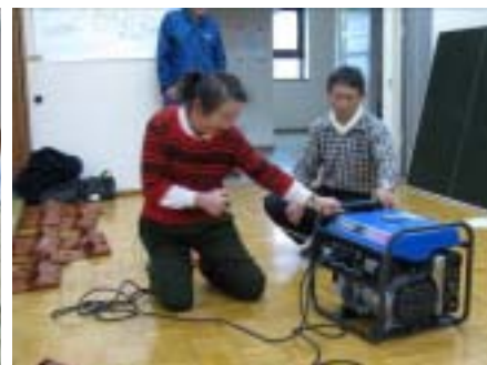
発電機の操作(高町地区)