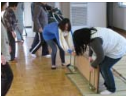
母子避難所の設営(日越地区)