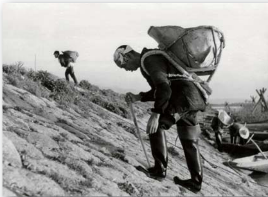
砂利を担ぐ人 (撮影:昭和30年・分田・村上孟氏)